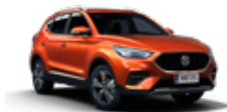
Hoxton Orange (metallic)