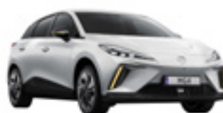
○ Dover White

*Plata se va face în Lei la cursul de vânzare CEC BANK din ziua efectuării plății (cursul SPOT de vânzare pentru tranzacții interbancare și cursul de vânzare la casierie pentru plățile în numerar la casieria Vânzătorului).