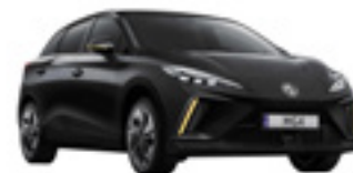
● Pebble Black